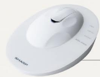
最終 糖化産物 測定機